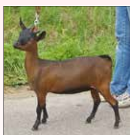
Jaantje vd Wolfhaag RK jongste geitlam