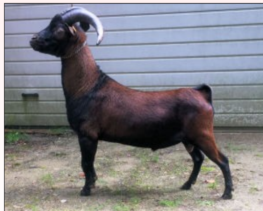
Links Nolan vh Rooiveld Rechts Bastiaan vh Knabbelhofke

Ook Nandje vh Rooiveld en Galant vh Heieinde konden een 1A laten optekenen.