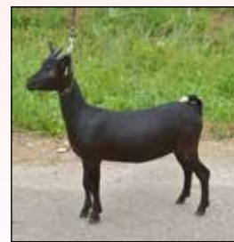
Edelweis vd Wacht- hoeve RK oudste lam