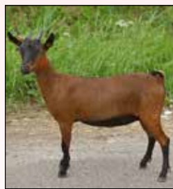
Model 15 vh Abdij- bos K oudste lam