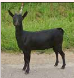
July vd Wolfhaag K jongste geitlam

Hilde 21 L van de Kruisberg goed type, fraai belijnt, mist conditie, nauw in achterbeentjes.